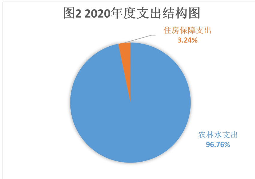
图2 2020年度支出结构图