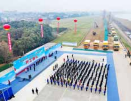
环湖大提浙江段后续工程开工仪式