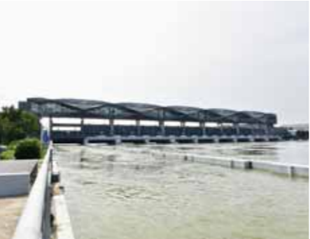
太湖局全力排泄太湖洪水

个堤防工程险工险段的现场督查……在2020年如此特殊的年份里能够拿出这样的成绩单,对太湖局来说是一个极大的挑战。年初疫情防控形势严峻,为了不影响进度,太湖局创新监管方式,对流域片部分生产建设项目通过网络、电话等方式开展靶向问,通过各类信息服务平台对部分重点项目开展“云抽查”,对发现的突出问题及时开展督查并印发整改意见。在新冠肺炎疫情得到控制后,太湖局实行全局总动员,全面压实压紧强监管任务,每周都派出数个工作组开展现场督查,每天工作时间10个小时以上,有些工作组外出持续时间甚至长达一个多月,尽最大努力把受疫情影响的时间抢抓回来。由于人手有限,太湖局不仅做到了业务部门和单位全覆盖齐上阵,同时还从综合部门抽调骨干力量组成工作组,紧密穿梭赴流域一线开展强监管有关工作,举全局之力履行了流域机构的责任和担当。