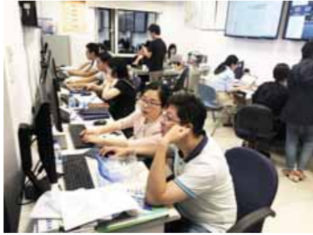
防汛值班室通宵达旦的忙碌