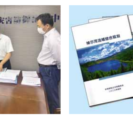
无人机助力水利行业强监管