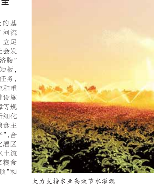
大力支持农业高效节水灌溉

仓廪实,天下安。粮食安全不仅是国家战略部署,更是人民心中的“头等大事”。松辽委将深入落实藏粮于地、藏粮于技战略,持续提升粮食安全保障能力,为把中国人的饭碗牢牢端在自己手上提供强有力的水支撑。