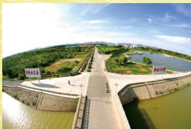
黑河东风场区治理效果

2010年，水利部商国家发展改革委安排中央投资40亿元用于西南地区中型水库建设，为“十一五”前4年总和的1.5倍。组织编制了《西南地区重点水源工程建设规划》和《西南地区重点小型水利设施建设规划》，以县域为单元，以水源工程为重点，大中小结合，多种措施并举。规划全面实施后，将有效解决西南地区严重的工程性缺水问题。