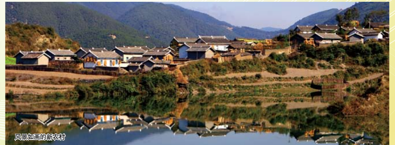
风景如画的新农村

在认真总结全国100个农村饮水安全示范县建设经验的基础上，制定了农村饮水安全建设检查与年度考核办法，并以县为单元建立农村饮水安全工程运行维护基金和成立水质检测中心为重点，开展了农村饮水安全工程长效良性运行机制的探索，取得了明显效果。