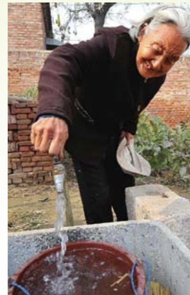
农家人喜饮安全水