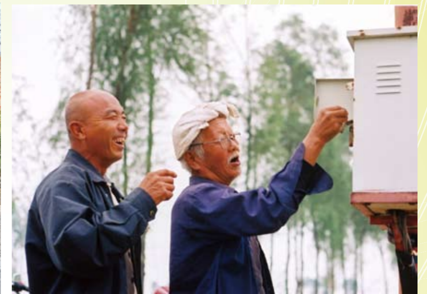
山西省清徐县农民用IC卡取水