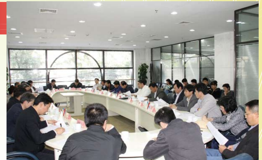
2010年10月15日，水利部召开治理水利工程建设领域突出问题专项工作领导小组第六次会议

截至2010年年底，全国水利行业共排查2008年以来立项、在建和竣工项目23169个，自查自纠工作全部完成。累计发现问题10937个，已整改问题7523个，占发现问题数量的68.8%。水利系统共罚没、补交资金2151.1万元，立案64件，给予党纪政纪处分75人，给予组织处理47人，移送司法机关50人。水利部被中央工程治理领导小组列为工程建设领域项目信息公开和诚信体系建设4个试点部门之一，明确7个流域机构和10个省(自治区、直辖市)水利厅先行开展试点；制定印发了《水利工程建设领域项目信息公开和诚信体系建设试点工作方案》，开通了水利工程建设领域项目信息公开和诚信体系建设专栏；进一步完善了全国水利建设市场信用信息平台。起草“监察部水利部联合开展水利工程建设监督检查的通知”，积极研究建立水利工程建设联合监督检查机制。专项治理工作及项目信息公开和诚信体系建设试点工作均得到中央领导小组的充分肯定。