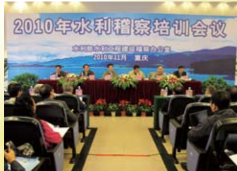
2010年11月，针对水利稽察特派员、特派员助理和稽察专家的培训会议在重庆召开