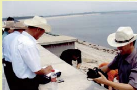
稽察工作组在开展病险水库除险加固项目稽察